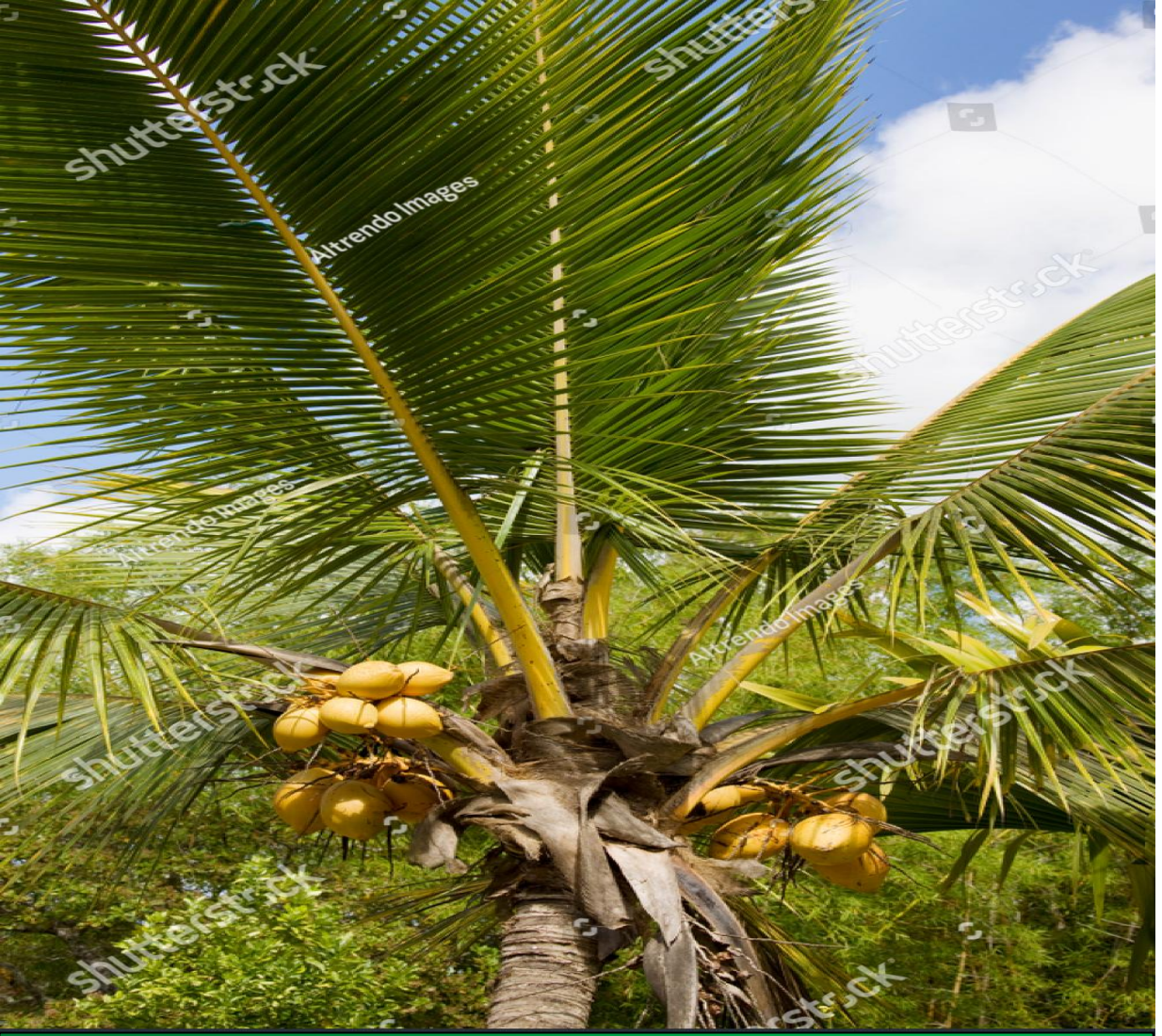
Coconut tree at Botanical Garden

बाग में तालिपो नामक एक विचित्र वृक्ष भी है। यही वृक्ष चालीस से साठ वर्षों में एक ही बार खिलता है। जब तालिपो खिलता है तब देश-विदेश से पर्यटक उसे देखने आते हैं। बाग में अनेक प्रकार के फल-फूल हैं। नारियल के छोटे-छोटे पेड़ों पर नीले-नीले नारियल दिखाई देते हैं।